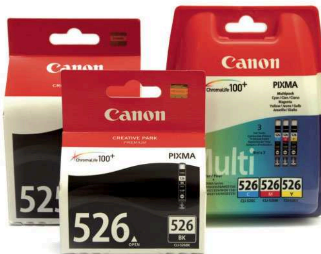
Zapas do większości drukarek atramentowych Canona składa się z pięciu atramentów.