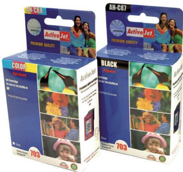
Zamienniki mogą być tańsze od oryginałów do tych samych drukarek nawet kilkakrotnie. Widoczne obok atramenty Active Jet 703 kosztują prawie dwa razy mniej niż HP 703.

skuteczność takiej metody. Do wielokrotnego zamykania nadaje się tylko konstrukcja z atramentem błękitnym. Nie wszyscy producenci zamienników przykładają należyłą uwagę do szczelnego zamknięcia nabojów. Bez tego nie tylko ubywa atramentu, ale mogą przy powierzchni tworzyć się cząsteczki stałe, a wraz z nimi zagrożenie zatkania drobnych kanałków i dysz. Ich udrożnienie, które polega na pompowaniu dużej ilości atramentu, jest kłopotliwe i kosztowne. Może przewrócić do góry nogami wynik kalkulacji na rzecz za-