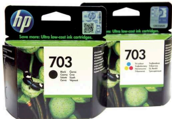
Atramenty HP z serii Ink Advantage są tańsze od innych atramentów tego producenta.